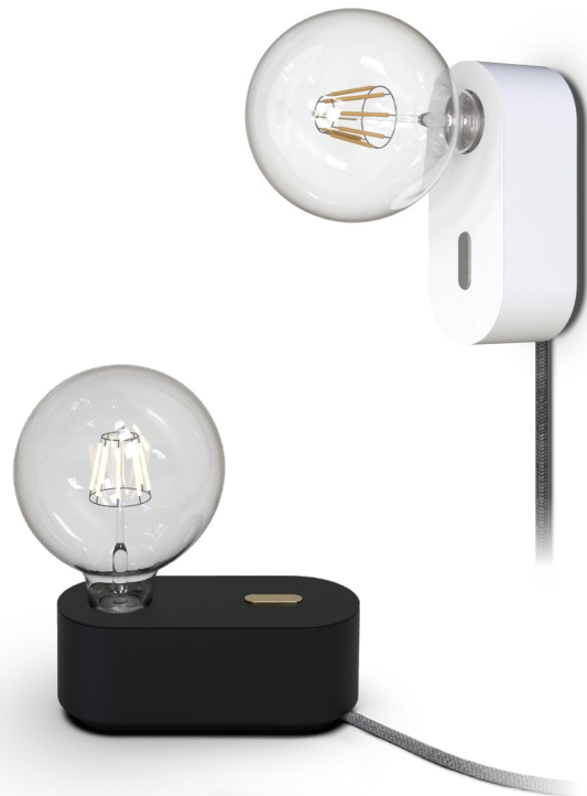
Exemplary representation with Sigor light bulb Light bulb recommendations at mawa-design.de/en